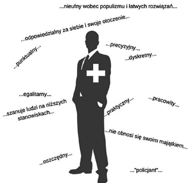
Ryc. 5. Typowy Szwajcar.

To dzięki tym cechom jego kraj osiągnął sukces ekonomiczny. Dobrobyt w Szwajcarii nigdy by nie istniał lub nie osiągnął aż takiej skali, gdyby nie podejście Szwajcarów do pracy i pieniędzy. Szwajcarzy dużo pracują i dużo zarabiają – to jest fakt. Jak już pisałam, obywatele Szwajcarii odrzucili w referendum inicjatywę przedłużenia urlopu do sześciu tygodni w roku. Zdecydowaną większością głosów przypadł też populistyczny projekt ustanowienia bezwarunkowego dochodu dla każdego. Szwajcarzy wierzą, że tylko praca może być podstawą bogactwa.