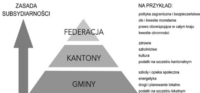
Ryc. 3. Zasada subsydiarności: decyzje, które mogą zostać podjęte na niższym poziomie piramidy zasady subsydiarności, nie powinny być podejmowane na wyższym poziomie.

swoją religię oficjalną, podczas gdy większość kantonów wiejskich pozostała katolicka. Ten podział doprowadził do wojen religijnych pomiędzy kantonami, które targały krajem głównie w XVI wieku. Niepokoje wewnętrzne zakończył pokój w Kappel, który ustanowił autonomię religijną każdego z kantonów.