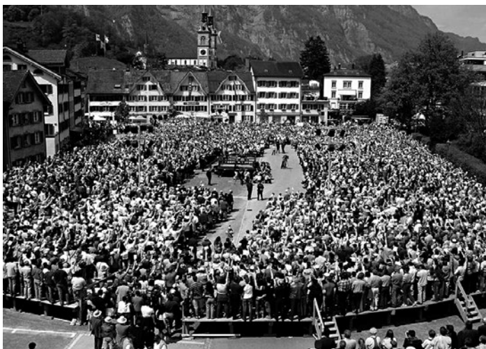
Ryc. 2: Głosowanie podczas tzw. Landsgemeinde

w tradycyjne regionalne stroje, i dla turystów, którzy tłumnie przybywają do miast i miasteczek tych kantonów, żeby uczestniczyć w tym unikalnym wydarzeniu. Żeby przypadkiem goście nie zakłócili głosowania, odgradza się ich w specjalnych strefach, a każdy mieszkaniec otrzymuje kartę do głosowania, która służy do jego identyfikacji.